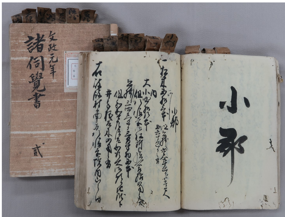
「諸伺覚書」(毛利家文庫11政理104)