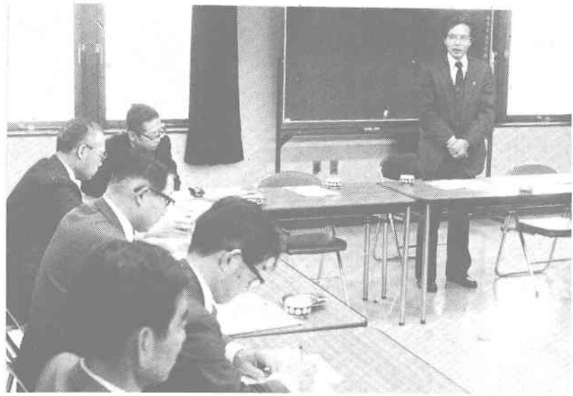
全史協役員会 (60. 3. 15)