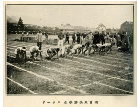
第9回大会(於:高商グラウンド大正12年) 『山口県教育第282号』より

昭和10年以後、昭和38年に吉敷に新陸上競技場ができるまで、大内御堀の競技場で県体育大会が開催されました。