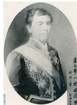
木戸孝允肖像絵葉書(雨村家文書299(9の5))