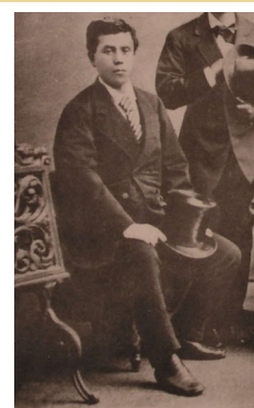
木戸孝允