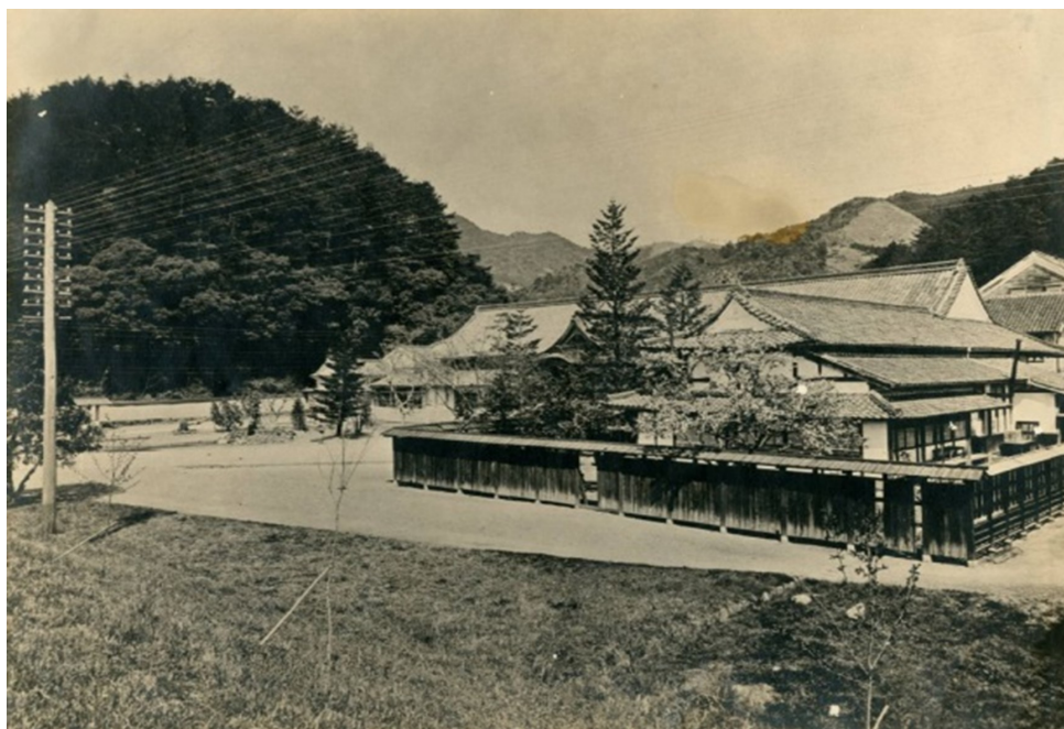
旧山口藩庁写真（戦前内務部写真169-1）