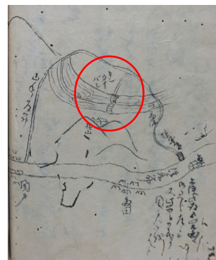
巡見使御通路記 (毛利家文庫2柳營 42<102の1>)

結局この時も錦帯橋の見物は実施されず。6月24日高森を出立した一行は一旦山陽道を離れ、錦帯橋へ向かいます。錦帯橋に到着すると、橋を渡り、河原に降りて、橋の組み物までも見物しています。なお、その後は来た道を戻り、御庄村・多