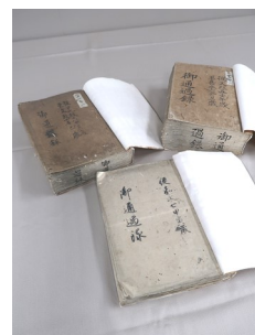
「御通過録」 (徳山毛利家文庫 寺社町方22~24)

徳山毛利家文庫「寺社町方」に含まれる「御通過録」は、山陽道を往来する大名や幕府役人に対して、徳山藩がどのような対応をしたかを記した記録です。上図左上から時計回りに、寛政6年(1794)~文政4年(1821)、文政5年~嘉永6年(1853)、嘉永7年~文久3年(1863)の3冊が伝存します。